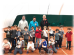
Assemblée Générale du Comité de Paris