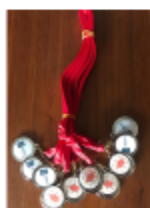
Assemblée Générale du Comité de Paris